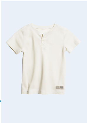
KIDS BOY No. 1 T-SHIRT AUS BIO-BAUMWOLLE 7,95 GR. 86-128