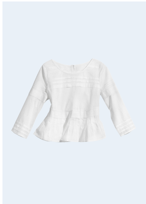
LADIES No. 18 TUNIKA AUS BIO-BAUMWOLLE 24,95