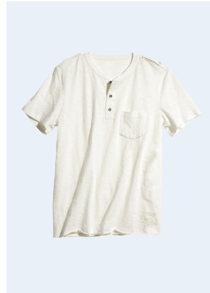
MEN No.3 T-SHIRT AUS BIO-BAUMWOLLE 14,95