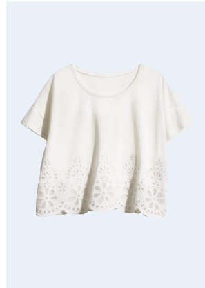
LADIES No. 27 TOP AUS BIO-BAUMWOLLE 19,95