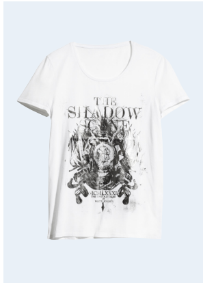
MEN No.2 T-SHIRT MIT BIO-BAUMWOLLE 9,95