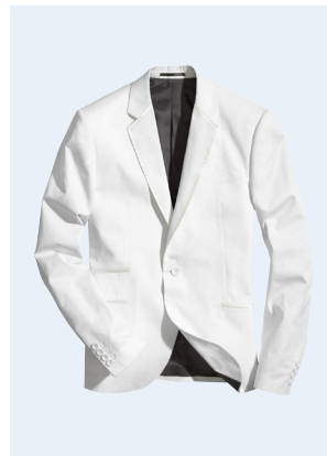
MEN No.7 SAKKO MIT BIO-BAUMWOLLE 29,95