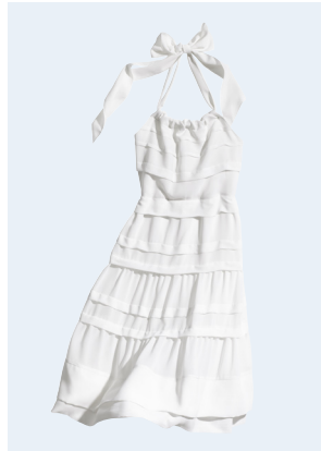
LADIES No.3 KLEID AUS RECYCELTEM POLYESTER 34,95