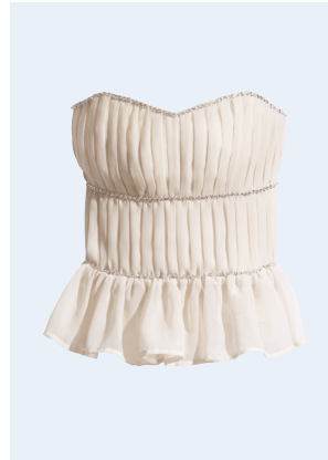
LADIES No. 15 TOP AUS RECYCELTEM POLYESTER 29,95