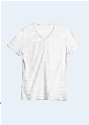
MEN No.1 T-SHIRT MIT BIO-BAUMWOLLE 12,95