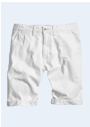
MEN No.9 SHORTS AUS BIO-BAUMWOLLE 9,95