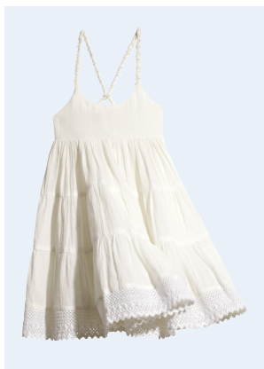
KIDS GIRL No.6 KLEID AUS BIO-BAUMWOLLE 9,95 GR. 86-128