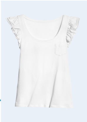
LADIES No. 25 TOP AUS BIO-BAUMWOLLE 9,95