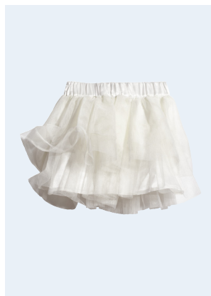
KIDS GIRL No.7 ROCK AUS RECYCELTEM POLYESTER 14,95 GR. 92-128