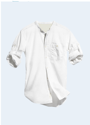
MEN No.5 HEMD AUS BIO-BAUMWOLLE 9,95