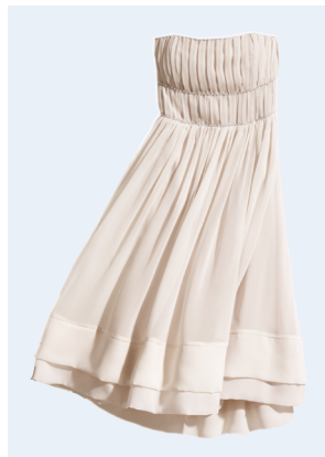
LADIES No.7 KLEID AUS RECYCELTEM POLYESTER 39,95