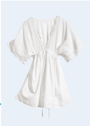
LADIES No.1 TUNIKA AUS BIO-BAUMWOLLE 14,95