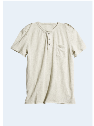
MEN No.4 T-SHIRT AUS BIO-BAUMWOLLE 14,95