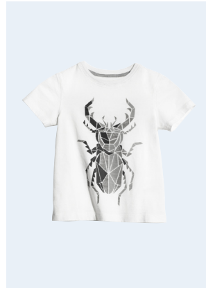
KIDS BOY No. 3 T-SHIRT AUS BIO-BAUMWOLLE 7,95 GR. 86-128