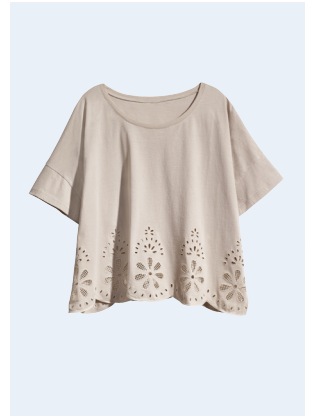
LADIES No. 28 TOP AUS BIO-BAUMWOLLE 19,95