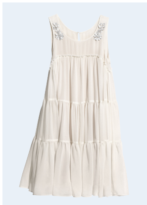
LADIES No.6 KLEID AUS RECYCELTEM POLYESTER 19,95