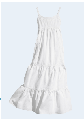
KIDS GIRL No.1 KLEID AUS BIO-BAUMWOLLE 9,95 GR. 134-170