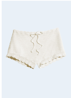
LADIES No. 30 SHORTS MIT BIO-BAUMWOLLE 24,95