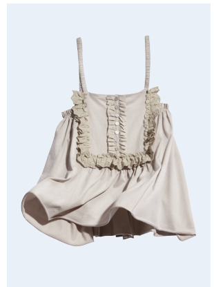
LADIES No.12 TOP AUS BIO-BAUMWOLLE 14,95