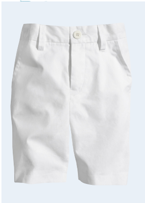
KIDS BOY No. 5 SHORTS AUS BIO-BAUMWOLLE 9,95 GR. 86-128