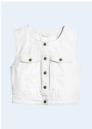
LADIES No. 21 WESTE AUS BIO-BAUMWOLLE 24,95