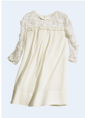
LADIES No.2 KLEID AUS RECYCELTEM POLYESTER 39,95