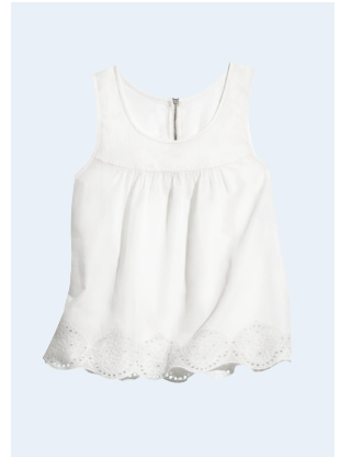
LADIES No. 16 TOP AUS BIO-BAUMWOLLE 14,95