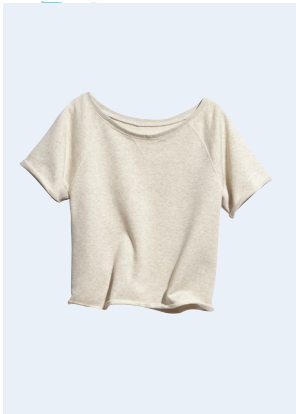
LADIES No. 29 TOP AUS BIO-BAUMWOLLE 14,95