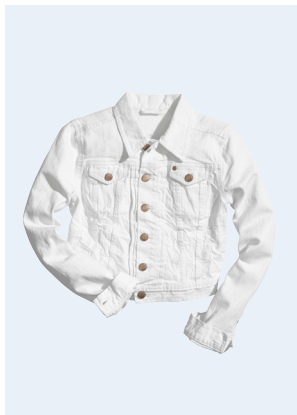
LADIES No. 22 JEANSJACKE AUS BIO-BAUMWOLLE 29,95