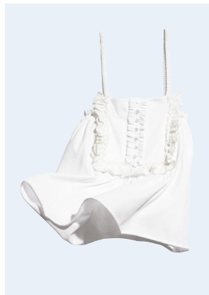
LADIES No.11 TOP AUS BIO-BAUMWOLLE 14,95