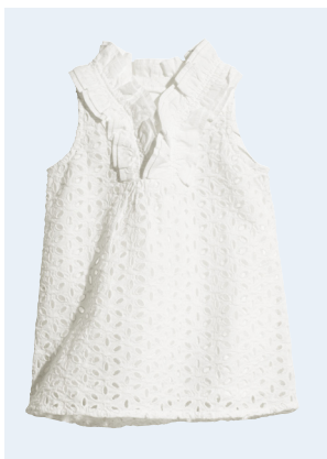
BABY No.1 TUNIKA AUS BIO-BAUMWOLLE 17,95 GR. 62-86