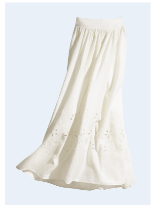
LADIES No. 36 ROCK AUS BIO-BAUMWOLLE 19,95