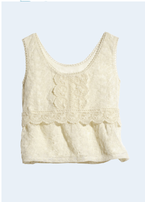
LADIES No. 17 TOP AUS BIO-BAUMWOLLE 24,95