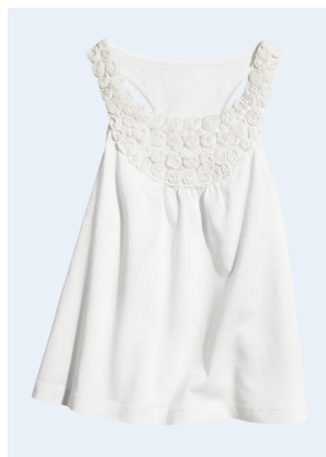
KIDS GIRL No.3 TOP AUS BIO-BAUMWOLLE 7,95 GR. 86-128