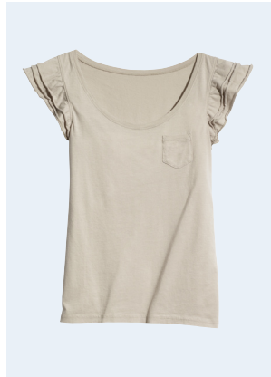
LADIES No. 26 TOP AUS BIO-BAUMWOLLE 9,95