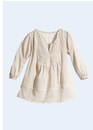
LADIES No. 19 TUNIKA AUS BIO-BAUMWOLLE 29,95