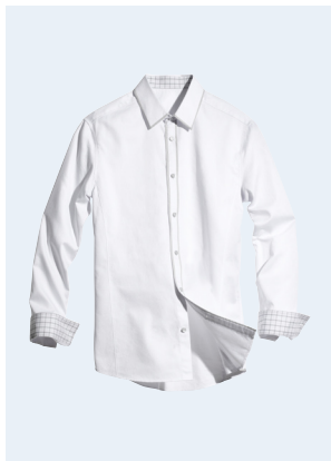
MEN No.6 HEMD AUS BIO-BAUMWOLLE 24,95