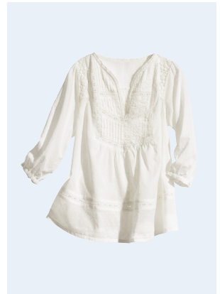
LADIES No. 20 TUNIKA AUS BIO-BAUMWOLLE 29,95