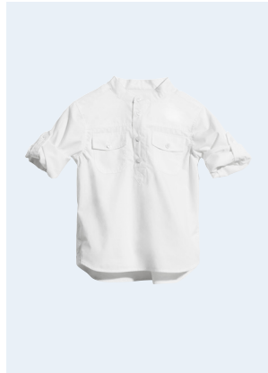
KIDS BOY No. 2 HEMD AUS BIO-BAUMWOLLE 9,95 GR. 86-128