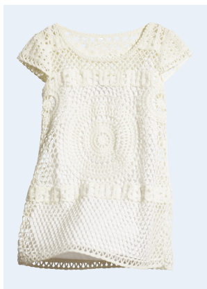
KIDS GIRL No.2 KLEID MIT BIO-BAUMWOLLE 24,95 GR. 134-170