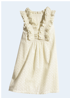
LADIES No.10 KLEID AUS BIO-BAUMWOLLE 34,95