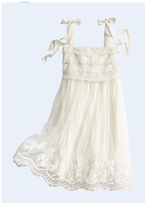
LADIES No.5 KLEID AUS RECYCELTEM POLYESTER 49,95