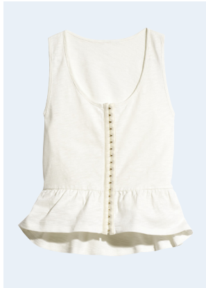
LADIES No. 14 TOP AUS BIO-BAUMWOLLE 14,95