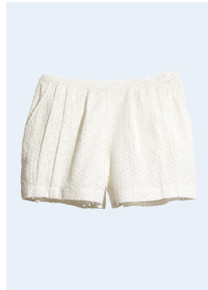
LADIES No. 31 SHORTS AUS BIO-BAUMWOLLE 14,95