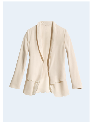
LADIES No. 24 BLAZER AUS RECYCELTEM POLYESTER 39,95