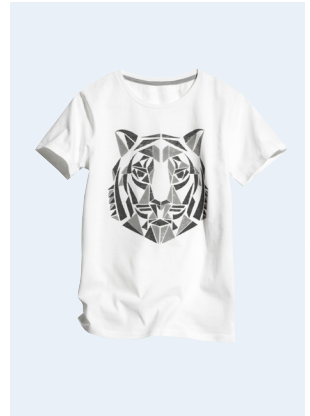
KIDS BOY No. 4 T-SHIRT AUS BIO-BAUMWOLLE 9,95 GR. 86-128