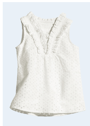
KIDS GIRL No.4 TUNIKA AUS BIO-BAUMWOLLE 17,95 GR. 86-128