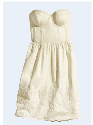
LADIES No.8 KLEID AUS BIO-BAUMWOLLE 39,95