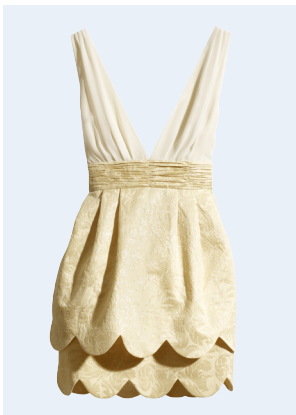
LADIES No.9 KLEID AUS RECYCELTEM POLYESTER 39,95