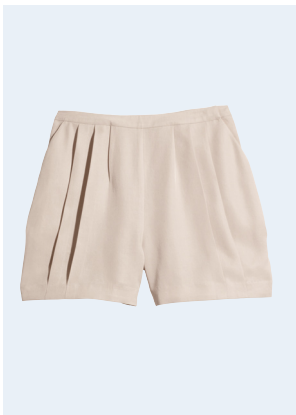
LADIES No. 33 SHORTS AUS TENCEL® 14,95