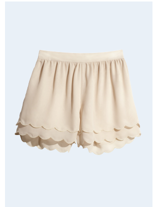
LADIES No. 32 SHORTS AUS RECYCELTEM POLYESTER 24,95