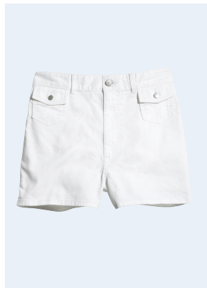
LADIES No. 34 SHORTS AUS BIO-BAUMWOLLE 24,95