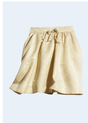
LADIES No. 35 ROCK AUS RECYCELTEM POLYESTER 29,95