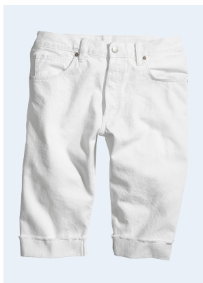
MEN No.10 SHORTS AUS BIO-BAUMWOLLE 29,95