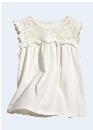
KIDS GIRL No.5 TOP AUS BIO-BAUMWOLLE 9,95 GR. 86-128