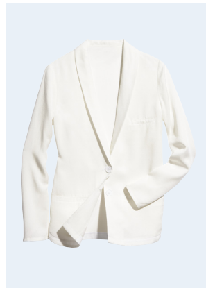
LADIES No. 23 BLAZER AUS TENCEL® 39,95