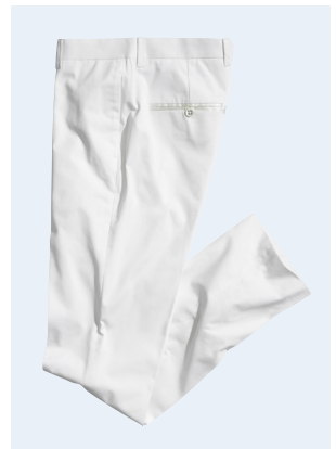
MEN No.8 HOSE MIT BIO-BAUMWOLLE 29,95