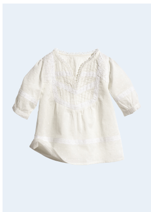
BABY No.2 BLUSE AUS BIO-BAUMWOLLE 17,95 GR. 62-86