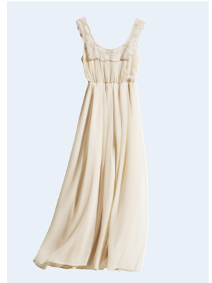
LADIES No.4 KLEID AUS RECYCELTEM POLYESTER 49,95