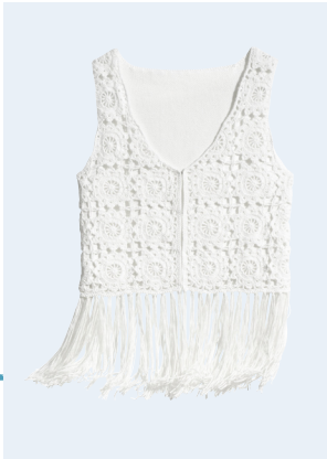
LADIES No. 13 WESTE MIT BIO-BAUMWOLLE 9,95